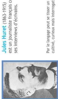
Jules Huret (1863-1915) est un journaliste français connu pour ses interviews d'écrivains.

Par le langage peut se tisser un échange entre le regard extérieur d'un spectateur cultivé, curieux mais interrogatif et celui, intime, de l'artiste sur sa propre œuvre.